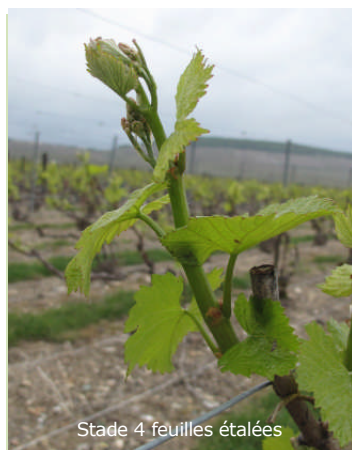
Stade 4 feuilles étalées

Pyrales : Remontées des chenilles toujours en cours.