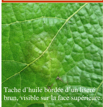
Tache d'huile bordée d'un liseré brun, visible sur la face supérieure.

Signaler toute tache suspecte (voir bulletin du 15 mai). Contact : 03.26.51.50.64 ou pascalie.pienne@civc.fr.