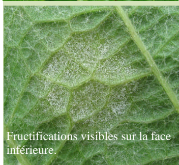
Fructifications visibles sur la face inférieure.

Ce bulletin est produit à partir d'observations ponctuelles réalisées du 13 au 17 mai sur 179 parcelles de vigne. S'il donne une tendance de la situation sanitaire régionale, celle-ci ne peut être transposée telle quelle à la parcelle.