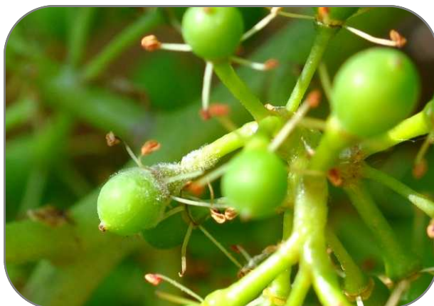
Symptômes sur jeune baie et sur pédicelle.

La gestion du risque oïdium reste toujours la priorité à ce stade de la campagne.