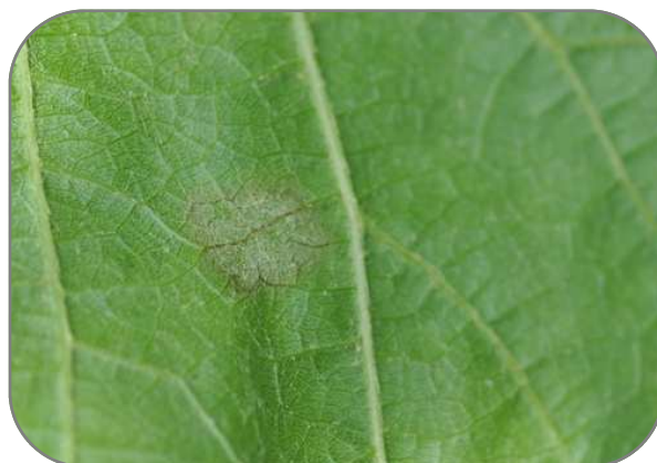
Symptômes face inférieure de la feuille.