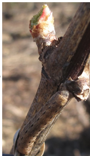
Chenille de noctuelle

Le seuil d'intervention correspond à un niveau d'attaque constaté supérieur à 15 % des ceps présentant au moins 1 bourgeon évidé.