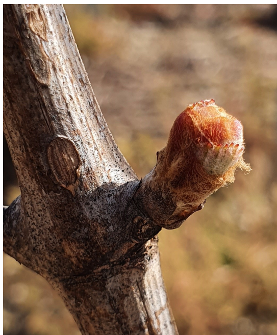
Bourgeon au stade 05 « débourrement »

Les températures étaient légèrement remontées durant la semaine dernière, mais elles ont à nouveau chuté pour le week-end, provoquant de nouveaux épisodes de gel. Les dégâts sont en cours d'estimation. En conséquence, la phénologie n'a pas ou presque pas progressé.