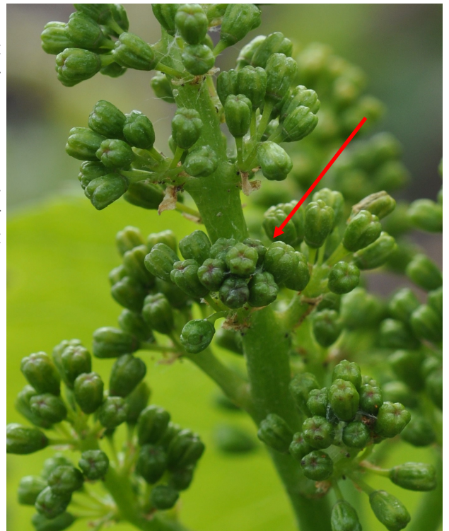
Glomérule sur inflorescence : quelques boutons floraux collés ensemble.

L'activité des tordeuses de première génération est très limitée à l'échelle du vignoble.