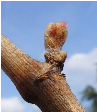
Bourgeon au stade 05 « débourrement »

Suite à un hiver doux et humide, la végétation a commencé à évoluer depuis plusieurs semaines.