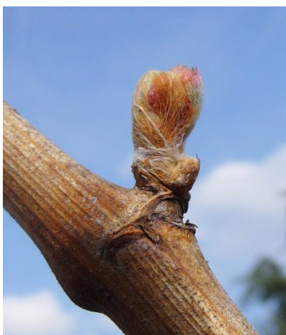
Bourgeon au stade 05 « débourrement »

Depuis début avril, les bourgeons ont commencé à évoluer. Une certaine hétérogénéité est remarquée entre cépages et entre régions. La plupart des parcelles oscillent actuellement entre le stade 03 « bourgeon dans le coton » et le stade 05 « pointe verte ». Les parcelles les plus précoces sont déjà au stade 06 « éclatement du bourgeon ».