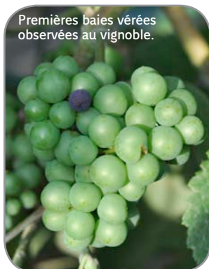
Premières baies vérées observées au vignoble.