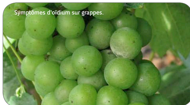
Symptômes d'oidium sur grappes.

Rappel : réaliser d'ici fin juillet, sur l'ensemble de l'exploitation, une dernière surveillance des parcelles