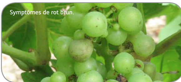
Symptômes de rot brun.

Comme la semaine dernière, quelques nouvelles parcelles expriment des symptômes d'oïdium, souvent limités à 1 ou 2 baies sur quelques grappes. Dans les parcelles présentant déjà de l'oïdium les semaines précédentes, la fréquence de grappes touchées augmente globalement peu. Par contre, l'intensité d'attaque est, en tendance, en légère hausse.