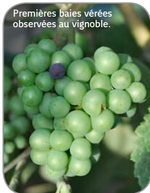
Premières baies vérées observées au vignoble.