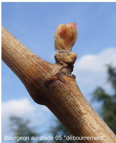
Bourgeon au stade 05 "débourrement"

Tordeuses : réseau de piégeage opérationnel dès la fin de la semaine.