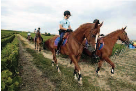
Loin d'être un simple folklore, la présence de la Garde républicaine, l'an dernier, a été déterminante dans la prévention de la délinquance.