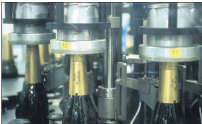
Le poids actuel de la bouteille de champagne est de 900 g contre 450 à 500 g pour les autres vins.