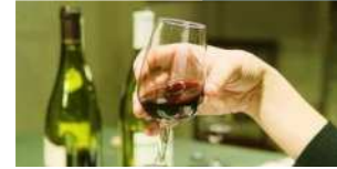
Agrandir la photo

En dépit des réserves de plusieurs États membres, la commission européenne sollicite aujourd'hui le vote du comité scientifique de l'UE sur le très controversé projet de règlement sur les vins biologiques. Plusieurs États membres (L'Italie, la France, l'Allemagne, le Royaume-Uni et les Pays-Bas) ont des vues différentes de Bruxelles sur certains aspects du projet, en particulier les taux de sulfites (SO 2 ). Le Comité européen des entreprises de vins (CEEV) estime, pour sa part, que l'approche de Bruxelles est « arbitrairement et exagérément restrictive ».