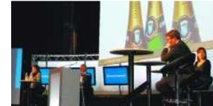
Agrandir la photo

Pour le comité interprofessionnel du vin de champagne, l'utilisation de nitrates a baissé de 40 % dans les vignes, les insecticides de 90 %, les herbicides de 30 % (ils n'évoluent pas depuis quatre ans). Il espère que ces bons résultats modifient les paramètres physico-chimiques généraux de la Dreal sur l'état écologique très moyen des cours d'eau en Champagne-Ardenne qui date un peu (2008). Pour Arnaud Descotes, responsable environnement du comité champagne, « les produits sont aujourd'hui utilisés de manière responsable et avec discernement dans le cadre de la viticulture durable. Les mentalités ont évolué, elles ont même été bousculées et nous portons une vraie dynamique applicable aux 15 000 exploitations car au-delà de l'intérêt économique (les phytosanitaires coûtent cher), il y a un enjeu sociétal important. C'est pourquoi nous tendons à faire évoluer les pratiques, à réduire les pesticides afin qu'on ne les retrouve plus dans l'eau, à préserver la biodiversité de notre activité, à assurer la gestion de nos déchets et à réduire nos dépenses énergétiques. » Des objectifs très ambitieux qui nécessitent l'investissement de chacun.