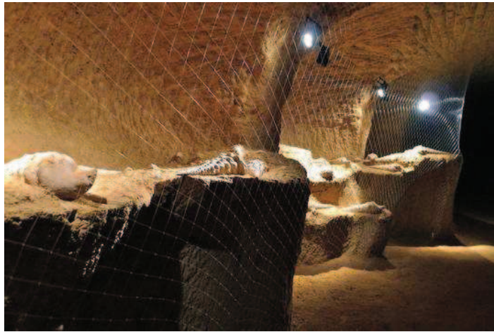
À de nombreux endroits, les fossiles sont à peine dévoilés et permettent de matérialiser la sédimentation.

À contre-temps des classiques visites de caves, le champagne « Legrand-Latour » à Fleury-la-Rivière propose une plongée dans la couche fossilifère du Lutétien. Rencontre avec un vigneron-géologue.