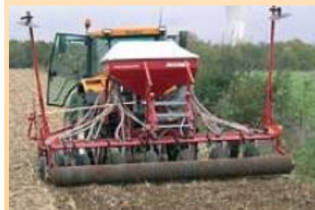
semis de céréales