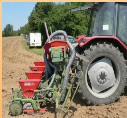
semoir mono graine équipé de déflecteurs

Les 16 spécialités qui ne figurent pas en gras dans le précédent tableau sont celles qui seront concernées par les dispositions précitées à partir du 1 er janvier 2011.